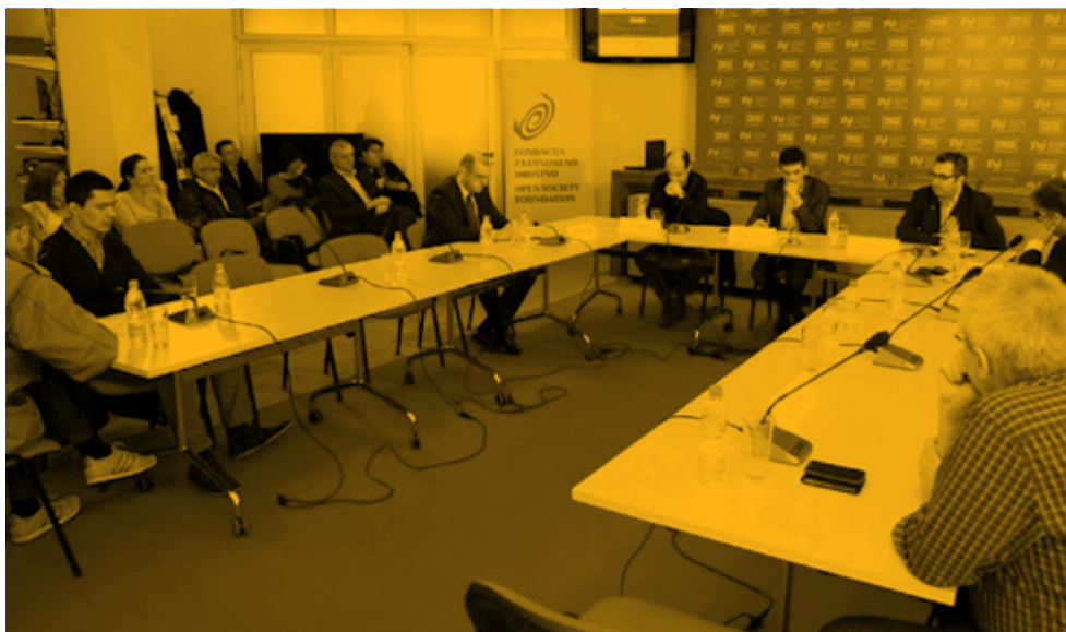
Debata u Press centru UNS-a, Beograd, 20. mart 2015. godine